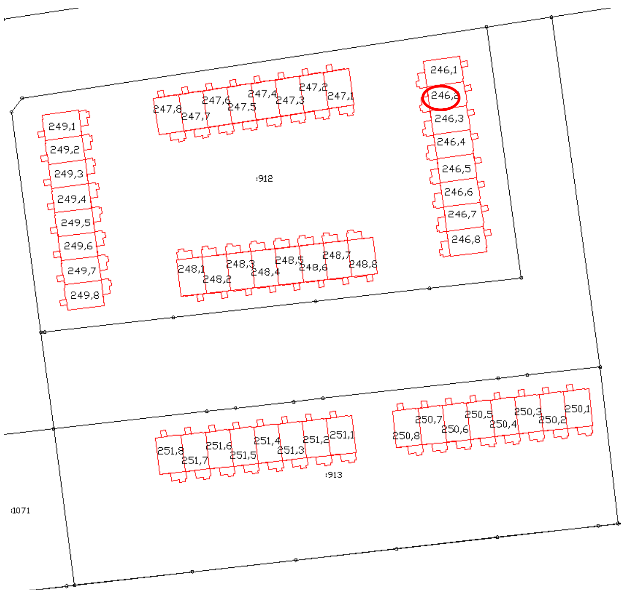
Схема размещения объекта долевого строительства в Доме и на Участке