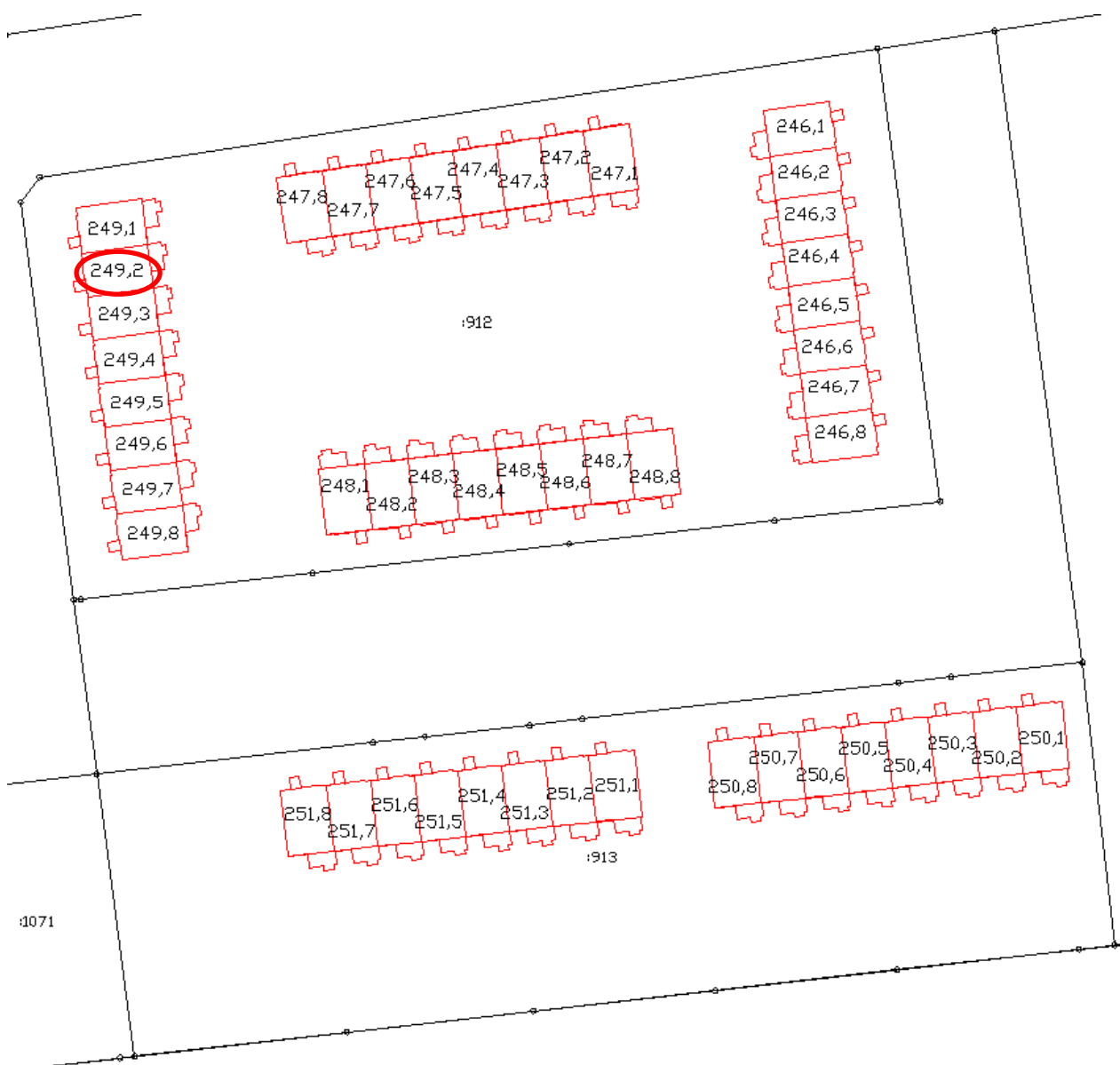
Схема размещения объекта долевого строительства в Доме и на Участке