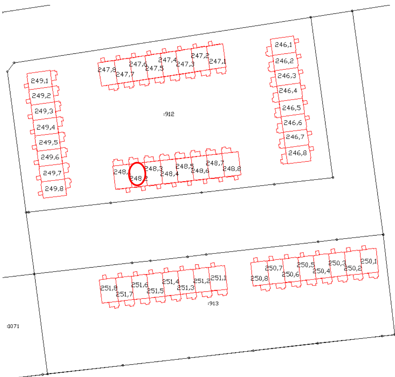
Схема размещения объекта долевого строительства в Доме и на Участке